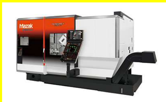
加工範囲 \phi 600 \times 590